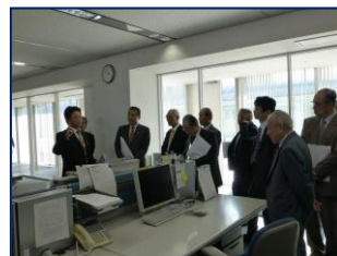
〈SBS ラジオ・SBS テレビ〉