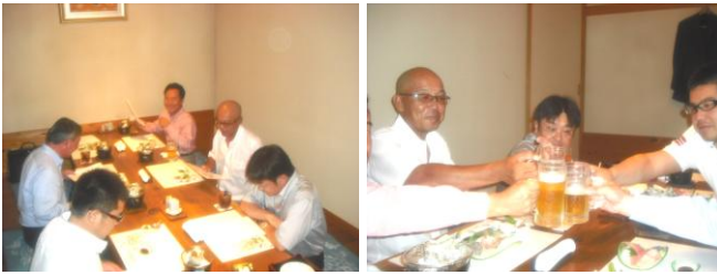
7月17日(水)に割烹「日本橋」にて炉辺会合。