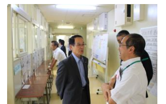
各教室などを見学するメンバー