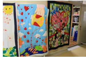
外での実習を見学する様子や生徒さんの作品