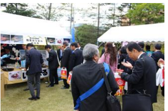
ご当地グルメ屋台