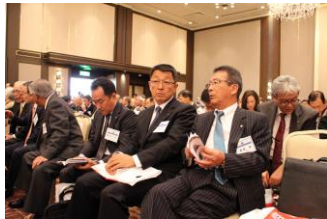
本会議の席の様子