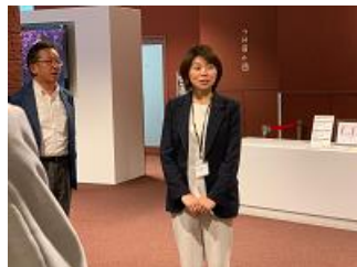
豊嶋君と館長さん