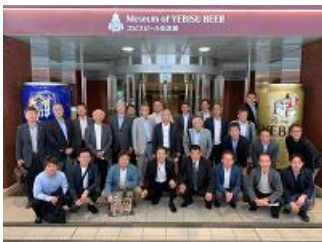
ビール記念館記念撮影