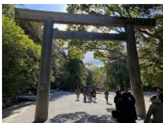
【伊勢神宮内宮参拝の様子】